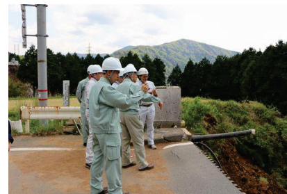
熊本地震会長特別調査団の活動