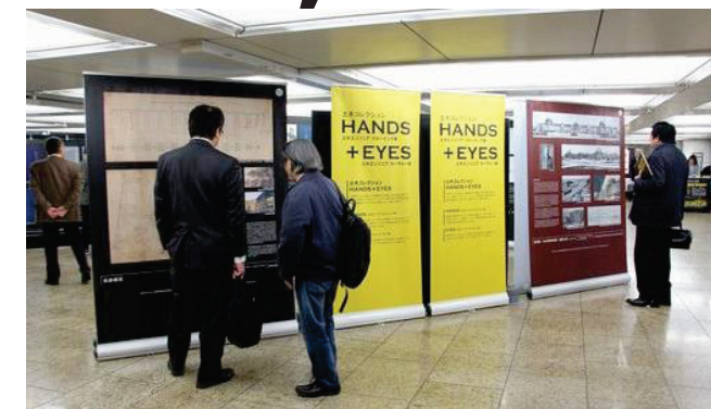
土木コレクション2016 (新宿西口)