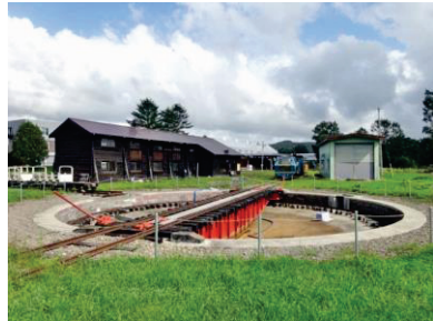
旧網走線開業時の鉄道施設群

土木学会では毎年、土木施設を選奨土木遺産として選定しています。土木遺産の顕彰を通じて、歴史的土木建造物の保存に資することを目的として2000年度に始まり、全国各地に認定施設があります。