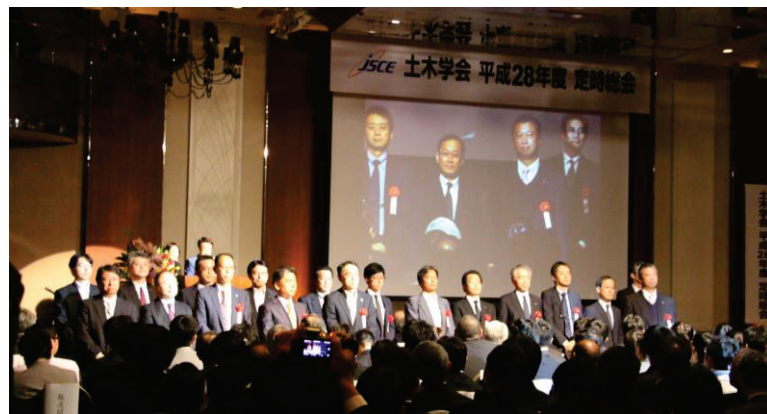
2016年度に受賞されたみなさん