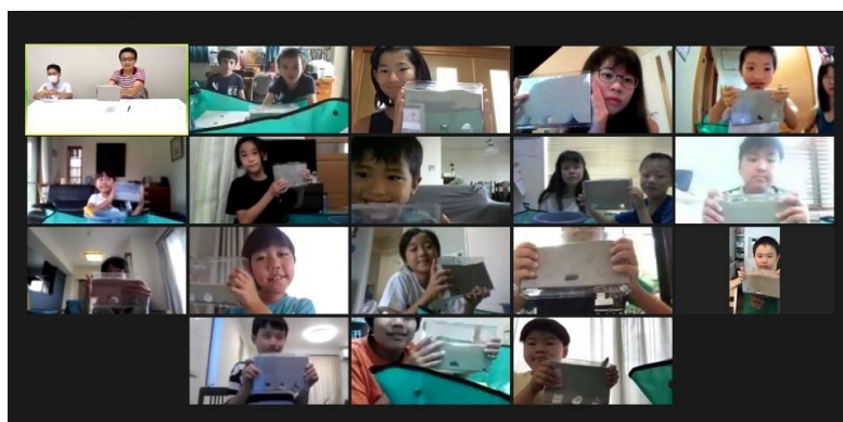
オンラインイベントに参加した子供たちの様子

問合せ先：公益社団法人 土木学会 土木広報センター 大西、佐藤、小林 〒160-0004 東京都新宿区四谷一丁目外濠公園内 TEL: 03-3355-3448 E-Mail: cprcenter@jsce.or.jp