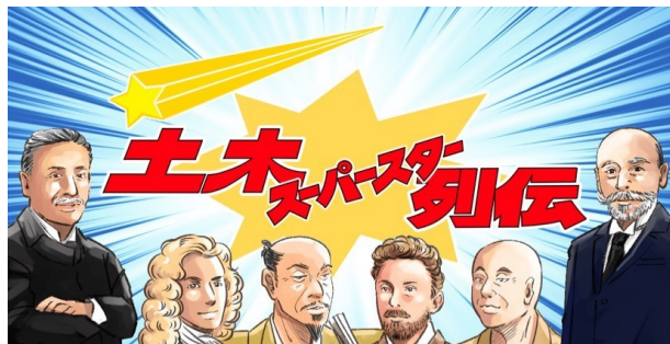
『土木スーパースター列伝』の扉絵