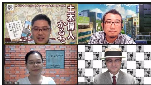
第1回土木偉人イブニングトークの開催の様子

http://doboradi.jsce.or.jp/2021/08/12/b-121/